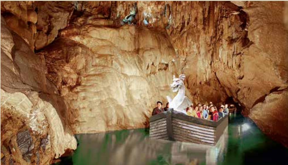
Kurze Bootsfahrt auf einem unterirdischen See