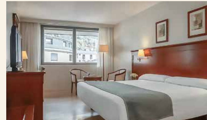
Zeitlos elegante Zimmereinrichtung

HolidayCheck: „100 % Empfehlung“, Stand: Mai 2026