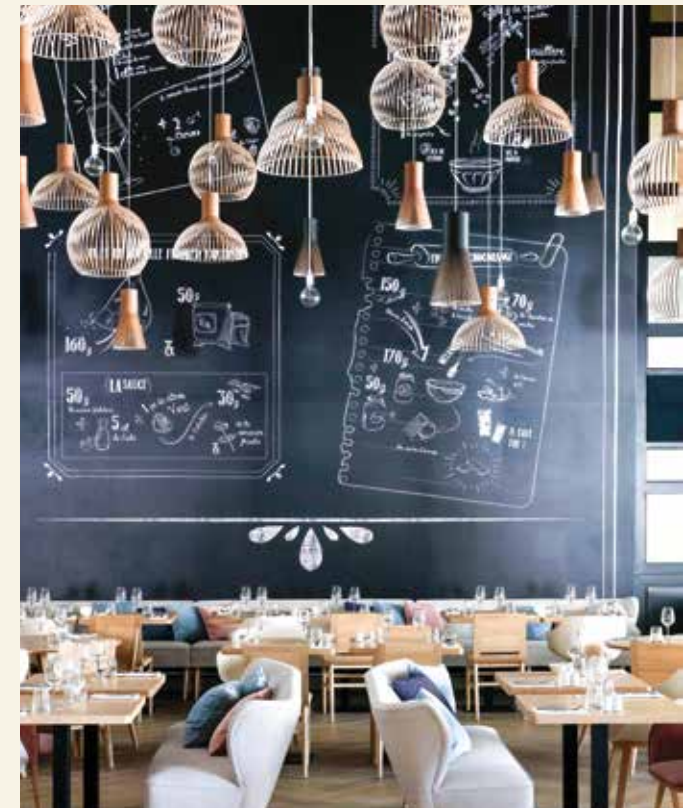
Wir speisen im modern-eleganten Hotelrestaurant

Booking.com: „Fabelhaft“, Stand: Mai 2026