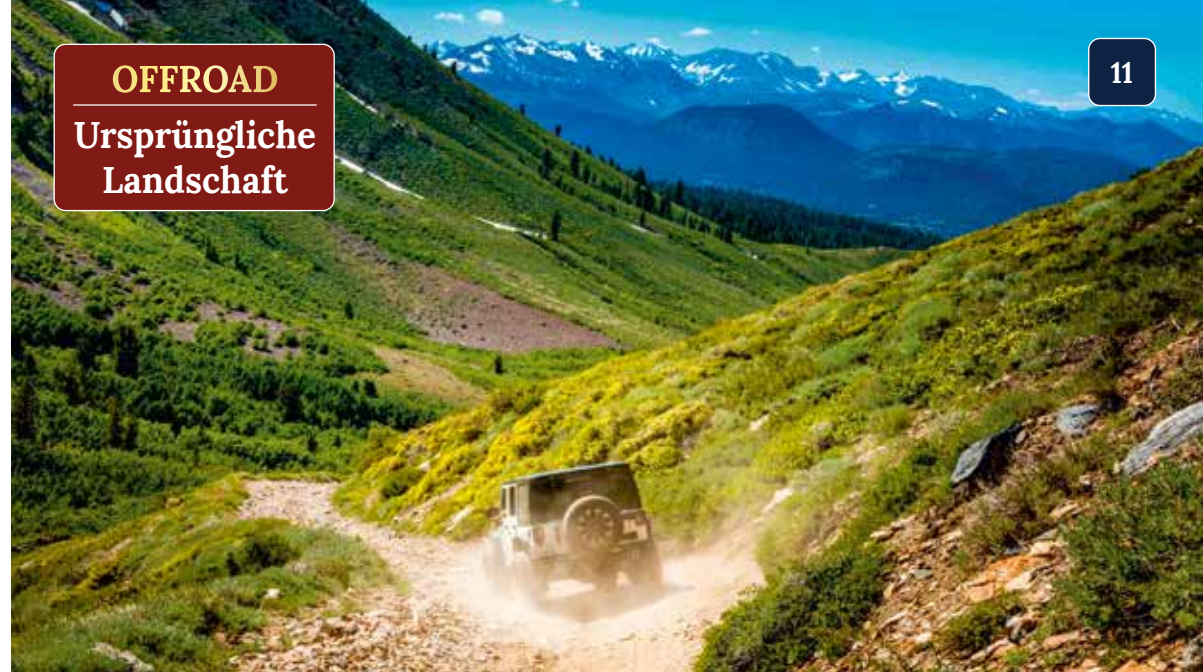
Safari mit kleinen und großen Geländewagen entlang alter Schmugglerwege