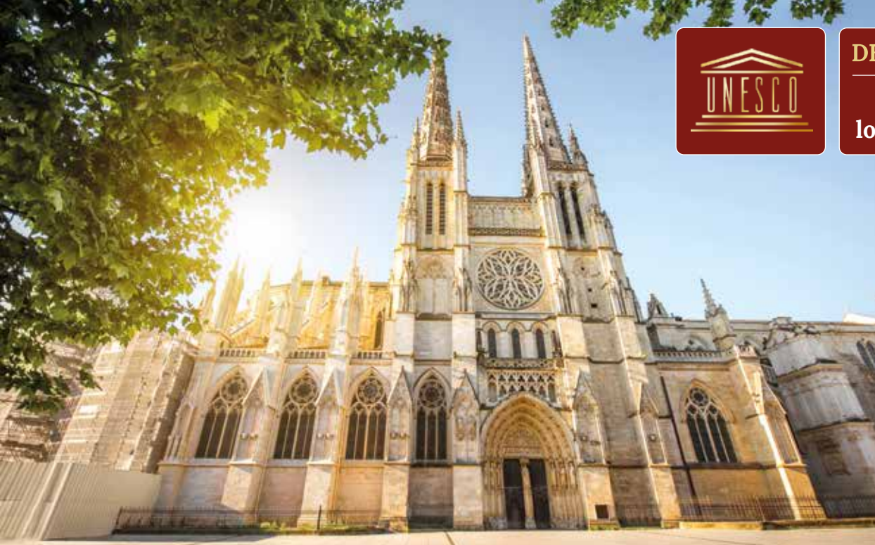
Imposante Fassade der gotischen Kathedrale Saint-André