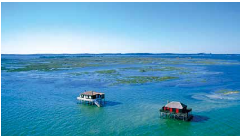
Ehemalige Fischerhütten auf Stelzen

Der Meeresnaturpark ist seit 1860 die Wiege der französischen Austernzucht und die größte Austernbrutstätte Europas. Hier haben Ebbe, Flut und Strömung außergewöhnliche Landschaften geformt. In manchen Jahren durchqueren mehr als 300.000 Vögel dieses Naturschutzgebiet. Eine Bootsfahrt zeigt uns die friedliche Schönheit der Bucht. Während eines Spaziergangs auf der Promenade von Arcachon entdecken wir einige Beispiele extravaganter Architektur.