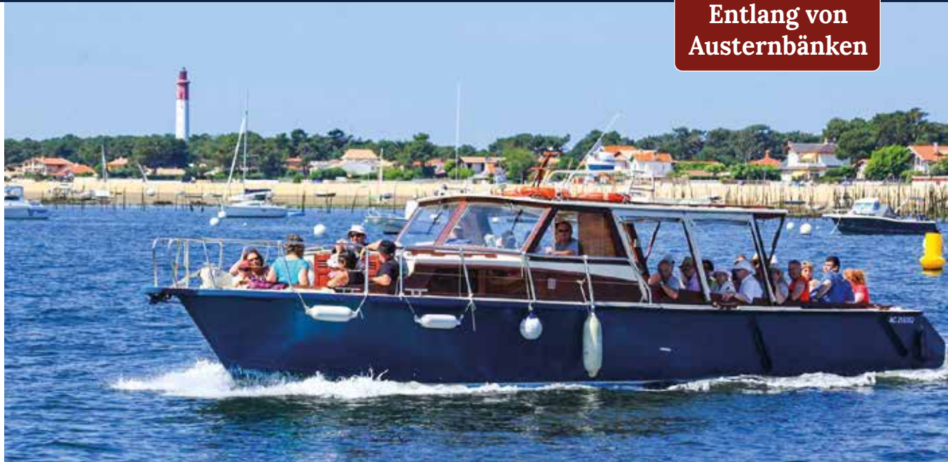
Wir lehnen uns entspannt zurück und genießen die Aussicht während der Bootsfahrt