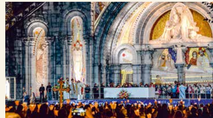
Ihre Teilnahme an der Kerzenprozession ist möglich