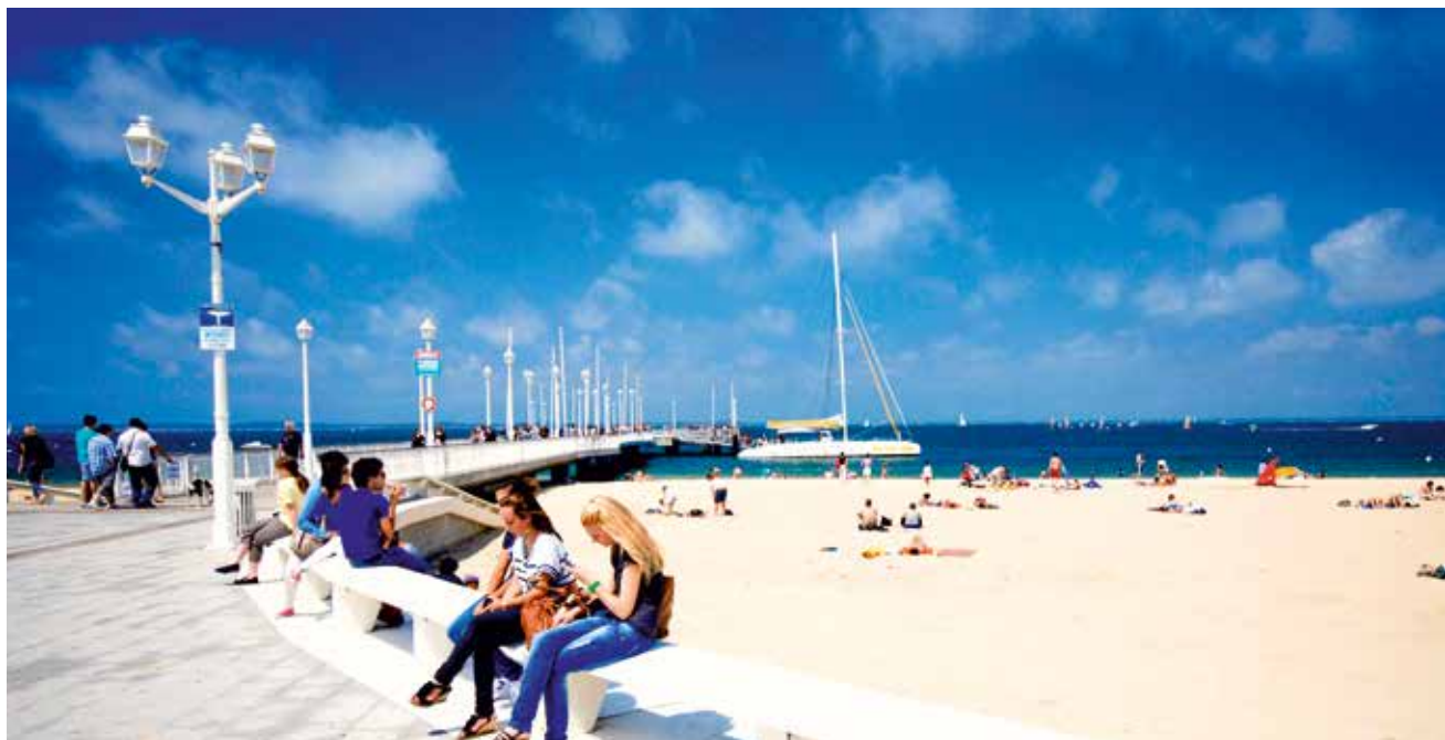
Die Strandpromenade von Arcachon lädt zum Verweilen ein