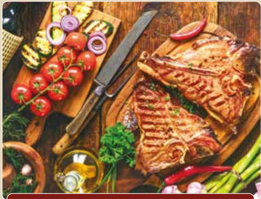
INKLUSIVE – Mittagessen