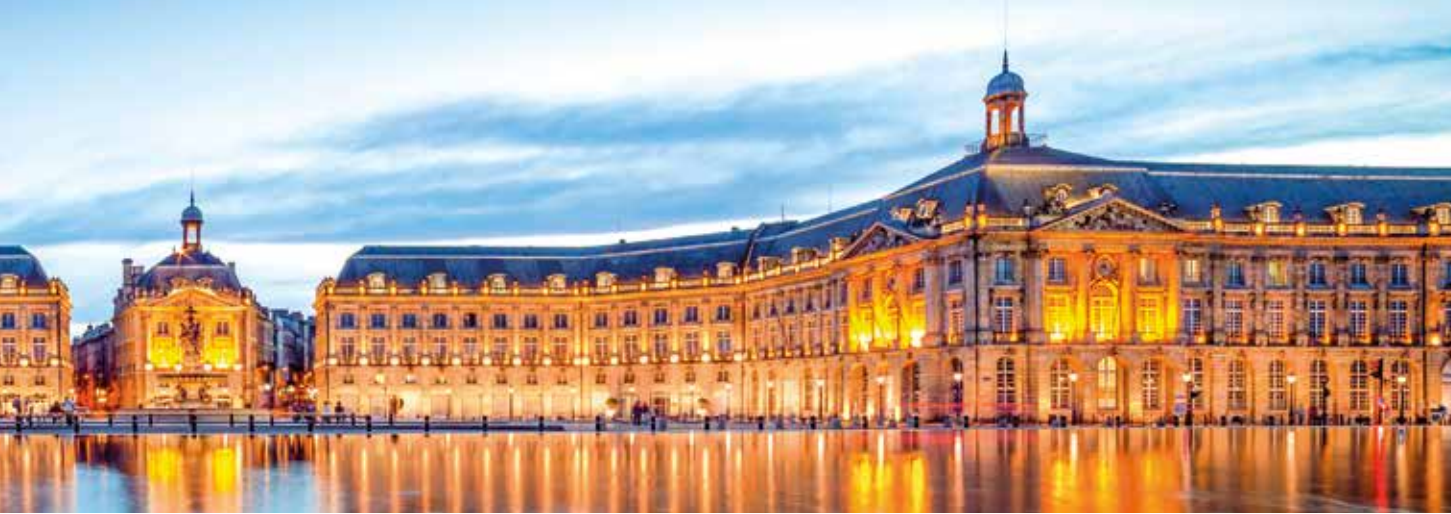
er wird mit Spiegeleffekten des größten Wasserspiegels der Welt in Szene gesetzt