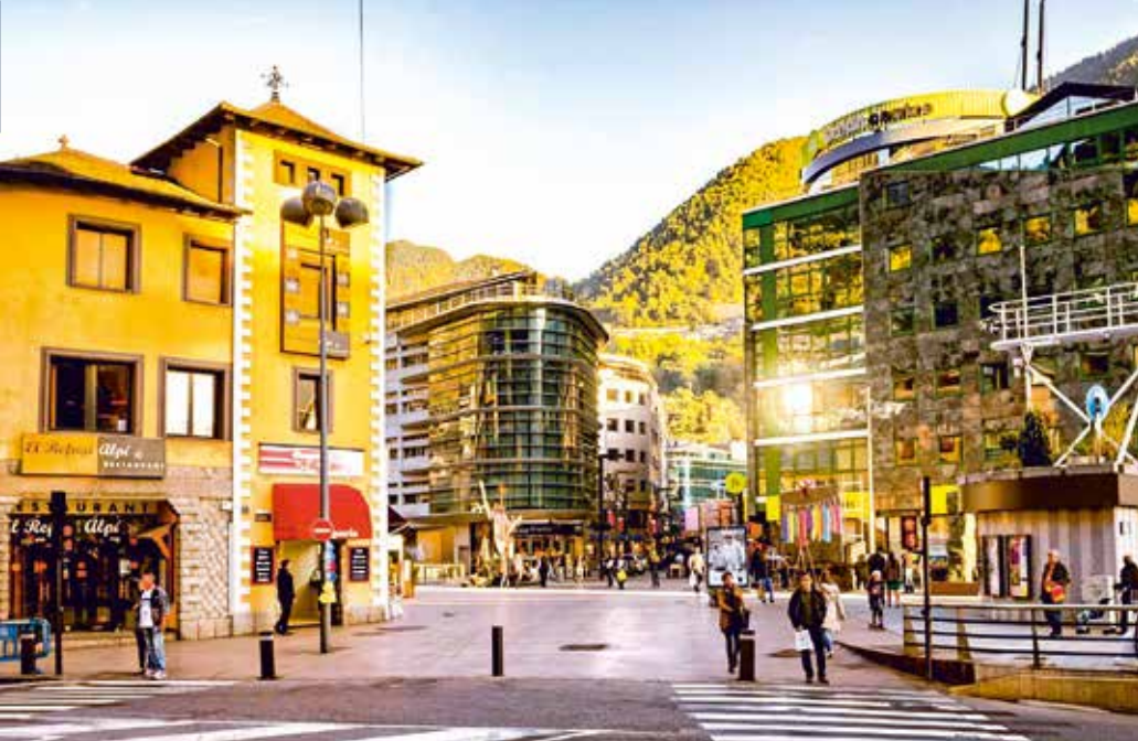
Innenstadt von Andorra la Vella