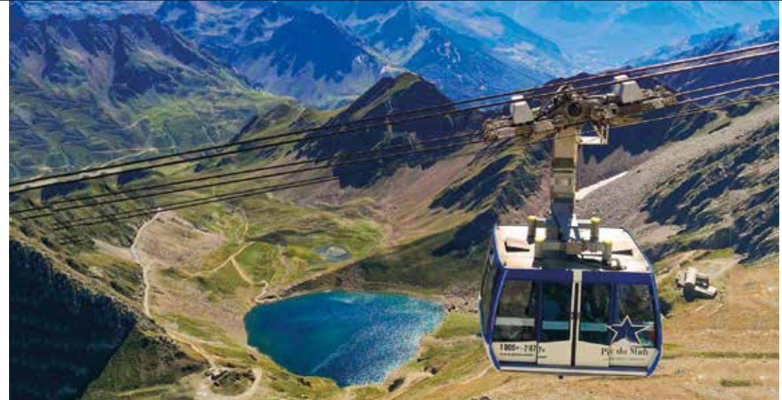
Seilbahnfahrt mit Blick auf die Ehrfurcht gebietenden Dreitausender

Höhenunterschied. Am tiefsten Punkt der Grotte wurde vor Millionen von Jahren vom Wasser ein imposanter, 50 Meter hoher Saal erschaffen.