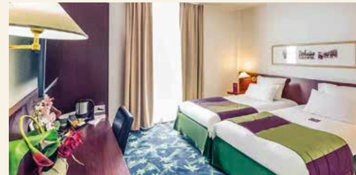
Die Zimmer sind komfortabel eingerichtet

HolidayCheck: „100 % Empfehlung“, Stand: Mai 2026