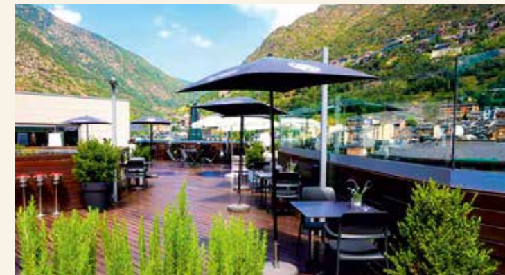
Dachterrasse mit Bar und Ausblick auf das Tal