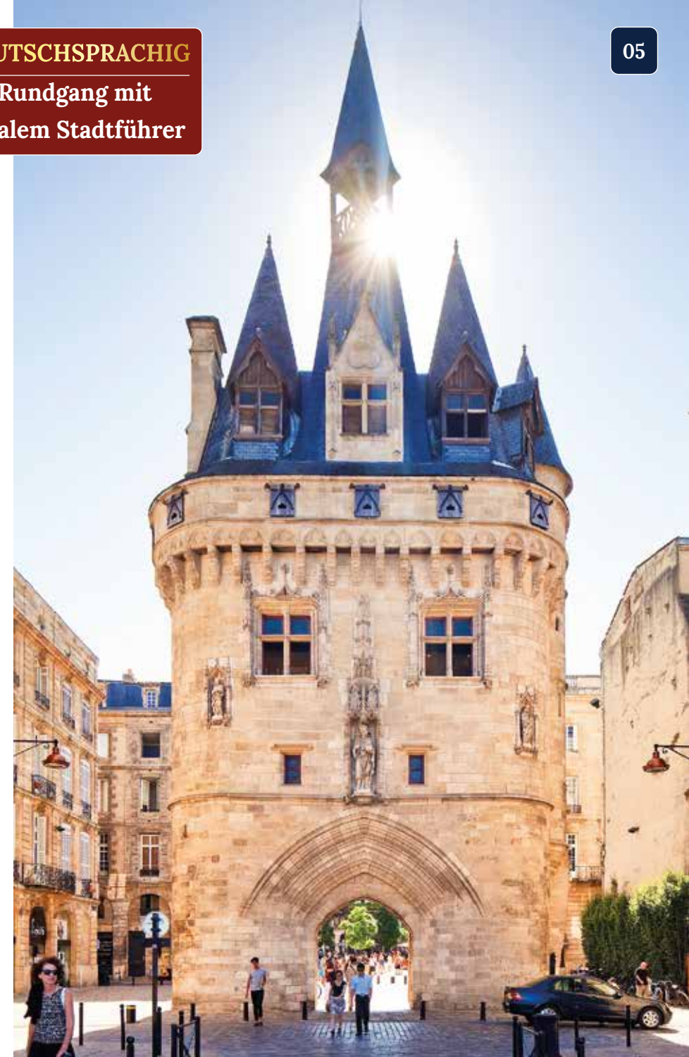
Das Stadttor Porte Cailhau wurde im Jahre 1495 errichtet

Die Hauptstadt des ältesten Weinbaugebiets edler Weine weltweit ist ein wahres Juwel der französischen Kultur und Geschichte. Diese faszinierende Stadt beherbergt ein außergewöhnliches Ensemble, das von der UNESCO zum Weltkulturerbe ernannt wurde und beeindruckende 376 denkmalgeschützte Monumente umfasst. Unter diesen historischen Schätzen befinden sich drei Sakralbauten, die Teil des berühmten Pilgerwegs nach Santiago de Compostela sind. Während unserer Stadtführung werden wir durch die malerischen historischen Straßenzüge und über prächtige barocke Plätze schlendern und uns in eine andere Zeit versetzt fühlen. Die Atmosphäre von Bordeaux, geprägt von seiner reichen Geschichte und architektonischen Schönheit, wird uns in ihren Bann ziehen und dabei unvergessliche Eindrücke hinterlassen.