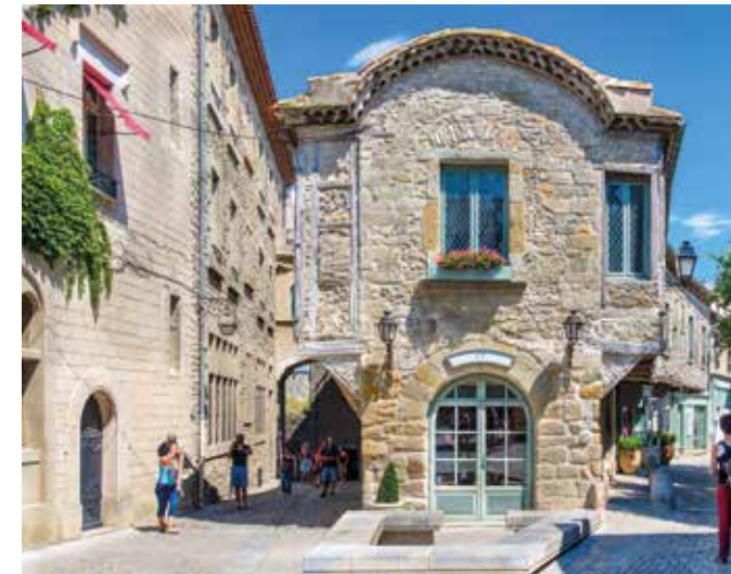
Charmante Gassen in der Cité von Carcassonne