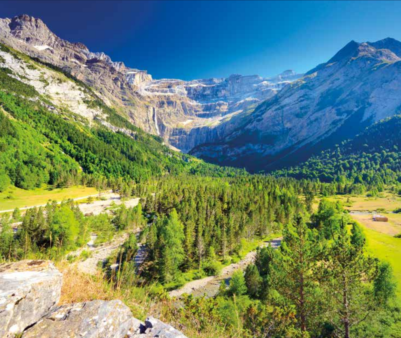
Eine Panoramafahrt ins landschaftliche Herz der Pyrenäen, nach Andorra la Vella