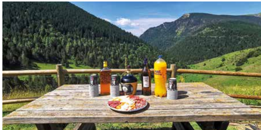
Apéro mit regionalen Leckereien