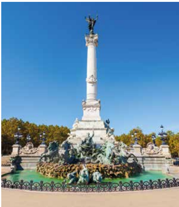
Girondins-Denkmal – circa 43 Meter hoch