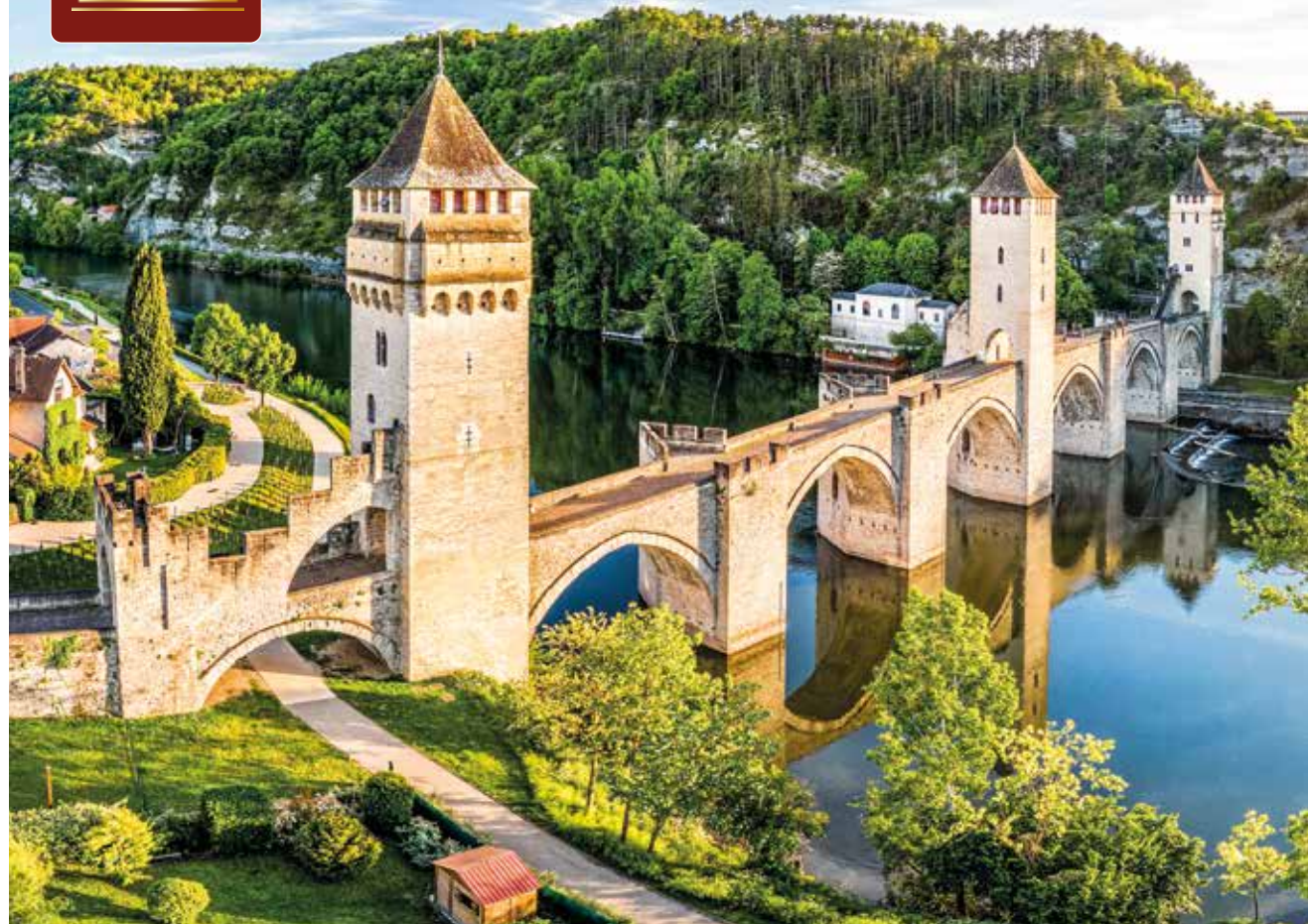
Die Pont Valentré ist eine beeindruckende Steinbrücke in Cahors und Teil des Jakobswegs