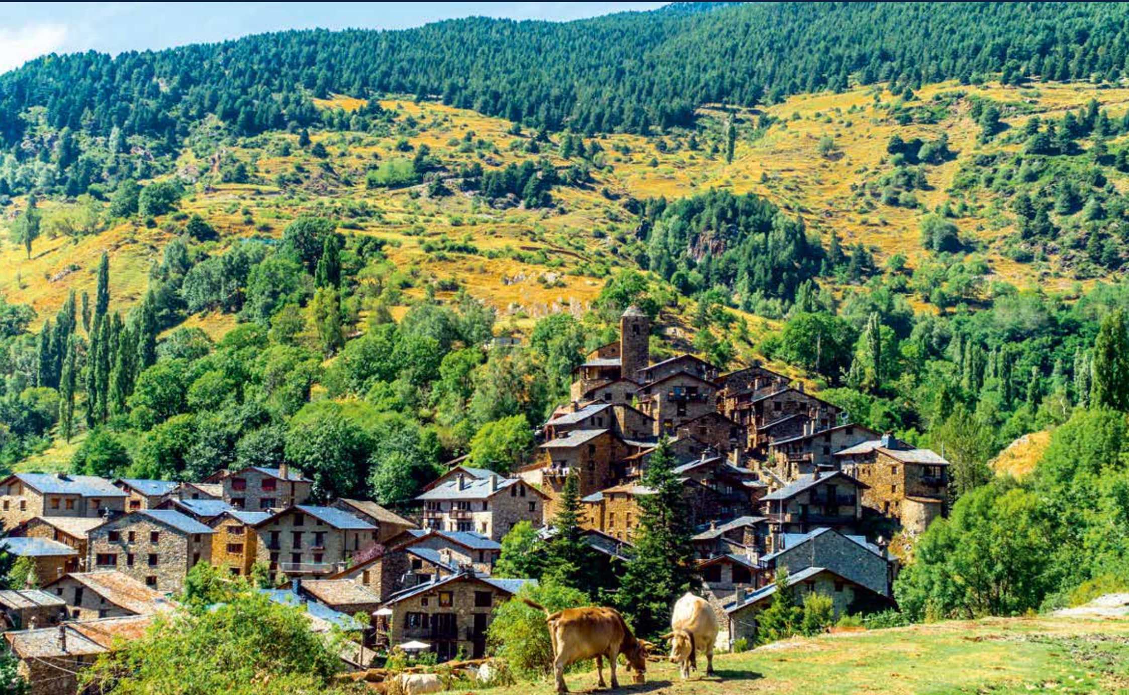
Die alte romanische Kirche im kleinen Bergdorf Os de Civís prägt das Ortsbild