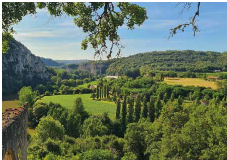
Das Tal des Lot ist eine der malerischsten Regionen Südfrankreichs