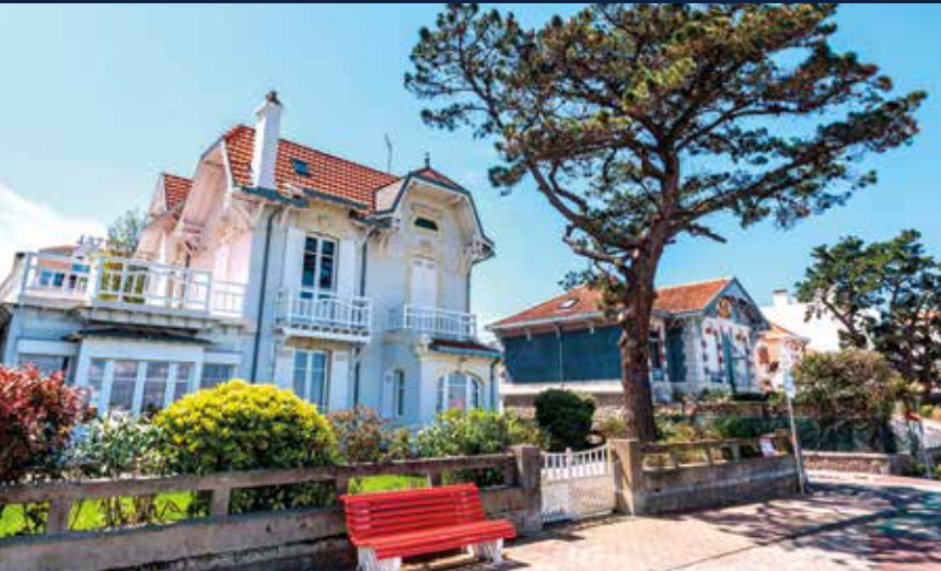
Alte Villen an der Promenade von Arcachon