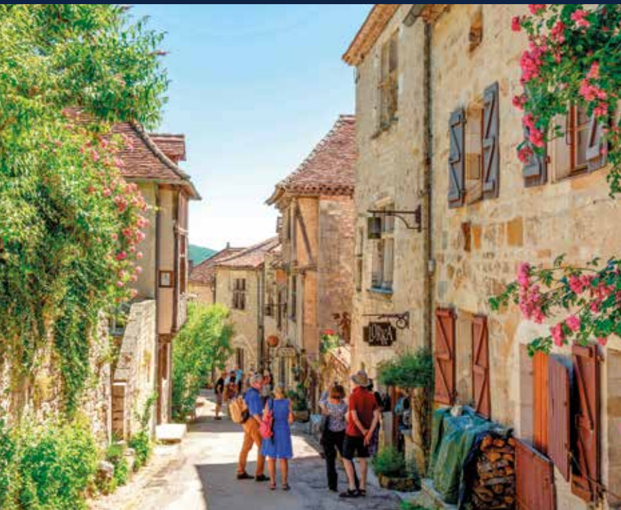
Spaziergang im denkmalgeschützten Saint-Cirq-Lapopie